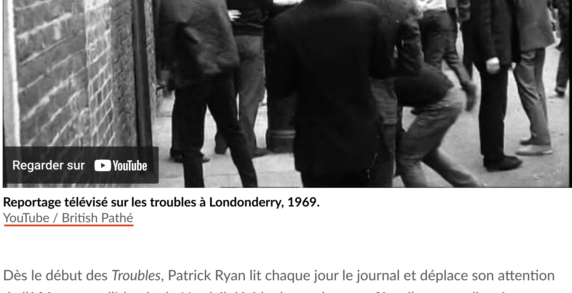
Reportage télévisé sur les troubles à Londonderry, 1969.