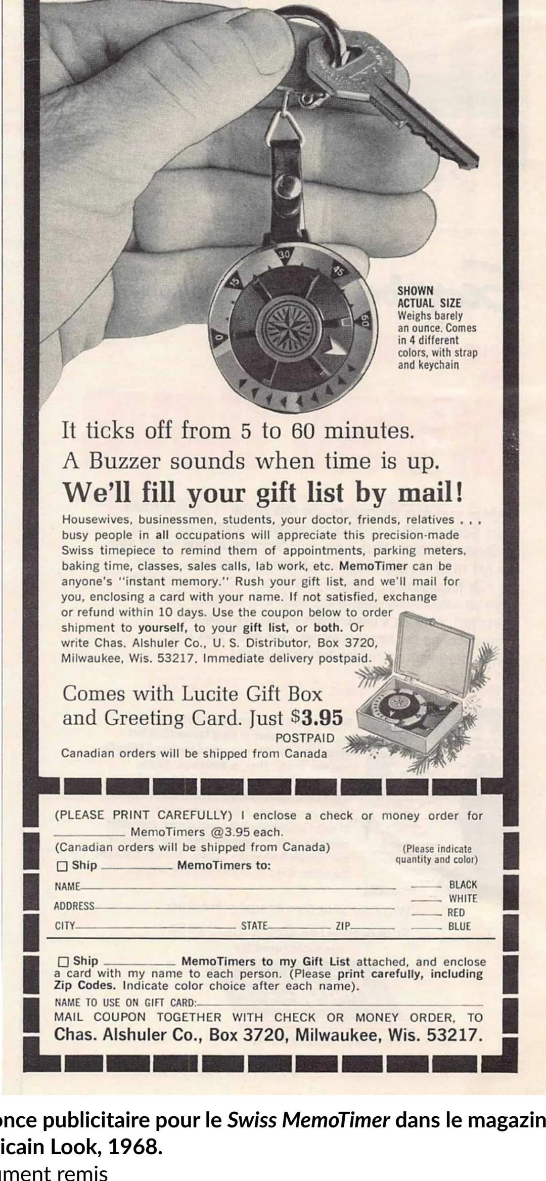
Annnonce publicitaire pour le Swiss MemoTimer dans le magazine américain Look, 1968. Document remis

Par un froid matin d'hiver de 1975, le prêtre flâne dans les rues de la cité de Calvin, regarde les vitrines et tombe en arrêt devant un magasin de montres. Non pas parce qu'il s'intéresse aux montres de luxe, mais parce qu'il a repéré un appareil minuscule, le Swiss MemoTimer . Ce réveil portable, de la taille d'un porte-clés, fonctionne comme une minuterie. Une fois réglé, le minuteur indique la fin d'une durée déterminée. La plupart du temps, il est employé comme rappel pour ne pas dépasser la durée de stationnement définie sur un parcmètre, mais les possibilités d'utilisation sont illimitées. D'ailleurs, la publicité pour le MemoTimer le précise bien: «Everyone you know can use this Swiss MemoTimer». Ryan ne pense pas une seconde aux parcmètres. Il y a plutôt vu un détonateur à retardement simple à utiliser. Un outil parfait pour les bombes de l'IRA.